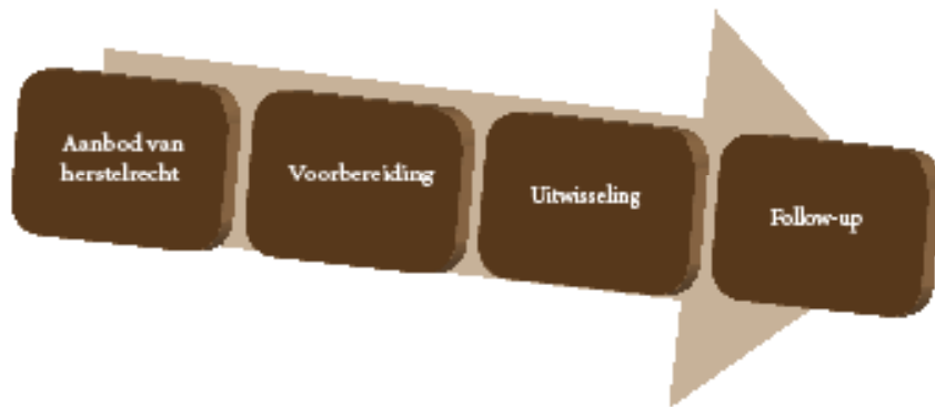
Fig 2: Het herstelrechtelijke traject